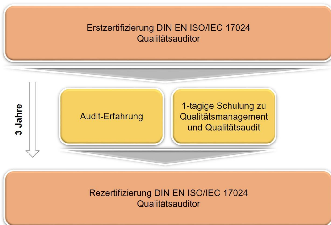
Abbildung 2: Schaubild Anforderungen für die Rezertifizierung.

Innerhalb der Dreijahresfrist können die Kandidaten nach erfolgter Prüfung ihr erlangtes Wissen in der Praxis umsetzen und sich entsprechend weitere Kenntnisse aneignen. Auf eine Überwachung wird verzichtet. Für die Rezertifizierung ist keine mündliche/schriftliche Prüfung vorgesehen, sondern eine Überprüfung der Nachweise zu den oben genannten Anforderungen.