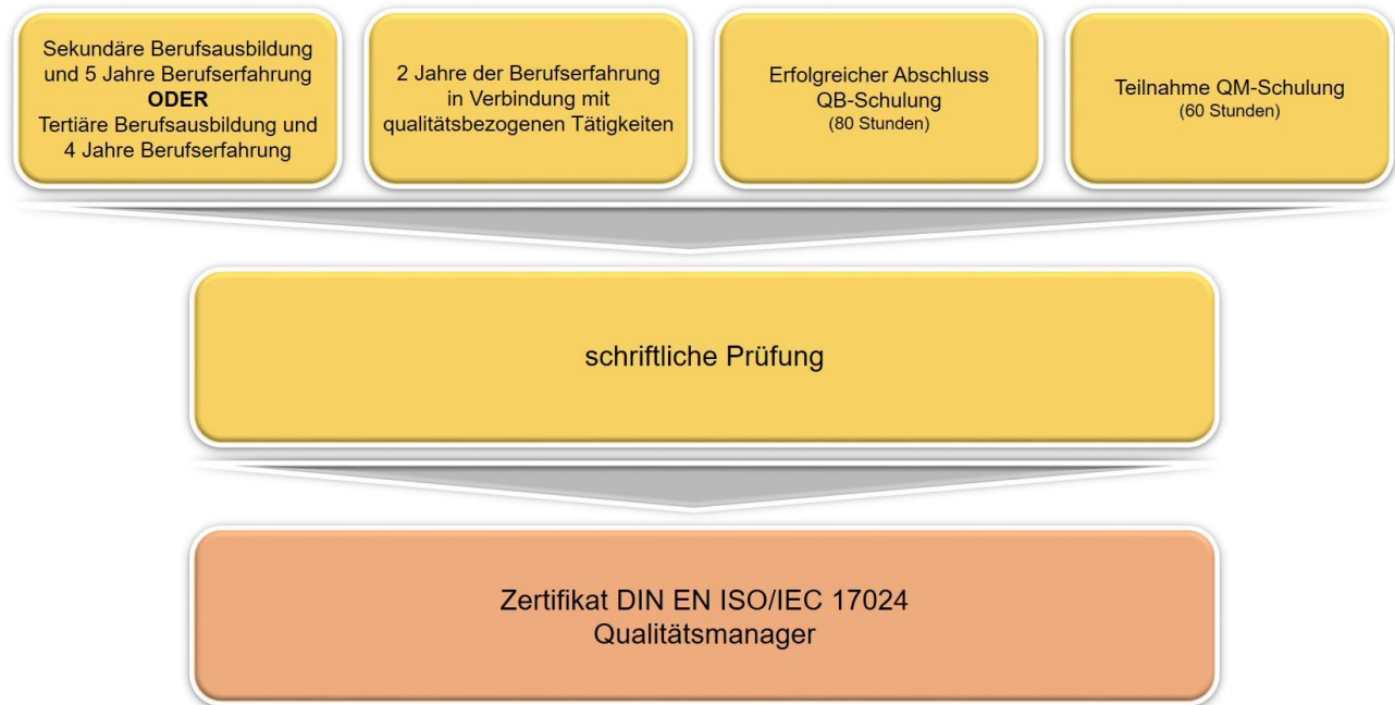
Abbildung 1: Schaubild Anforderungen für die Erstzertifizierung.

Der Antragsteller hat jedoch die Möglichkeit, fehlende Berufserfahrung und/oder fehlende Auditerfahrung innerhalb eines Jahres nach bestandener Prüfung nachzuweisen. Kann das Zertifikat wegen fehlender Voraussetzungen erst später erteilt werden, so reduziert sich die Zertifikatsdauer entsprechend. Es gilt dann das Datum der Prüfungskorrektur.